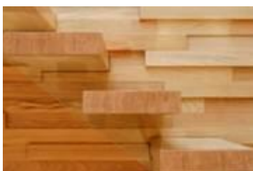
Close-up van enkele treden, de glazen balustrade en de bevestigingswand.

Barneveld, 9 juni 2011 – EeStairs ziet de vraag naar designtrappen in retailomgevingen sterk groeien. Nadat er in de afgelopen jaren veel shopmetamorfoses zijn uitgesteld, lijkt er in 2011 sprake van een kentering. Hierbij kiezen steeds meer retailers voor een opvallende trap in hun pand. In het tweede kwartaal neemt het vertrouwen van ondernemers in de economie toe en voorzien zij een omzetstijging.