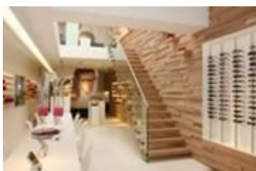
Sfeerimpressie begane grond.

Relevante HR-afbeeldingen bij dit persbericht: