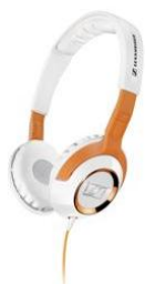
Sennheiser HD 229 Orange White