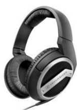
Sennheiser HD 449

Relevante HR-afbeeldingen bij dit persbericht: